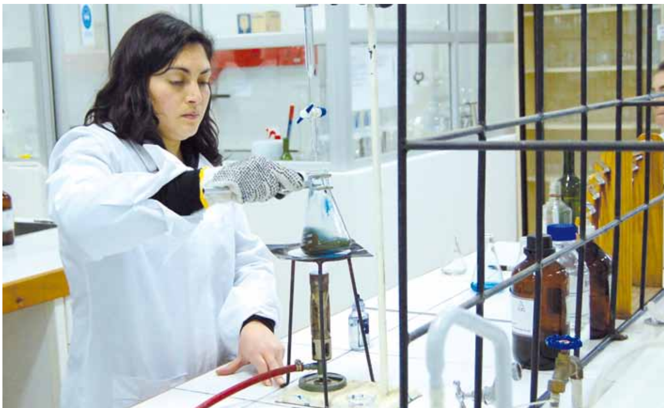
Desde 1981, como programa público, el Fondo Nacional de Desarrollo Científico y Tecnológico Fondecyt, estimula y promueve el desarrollo de estudios de excelencia.