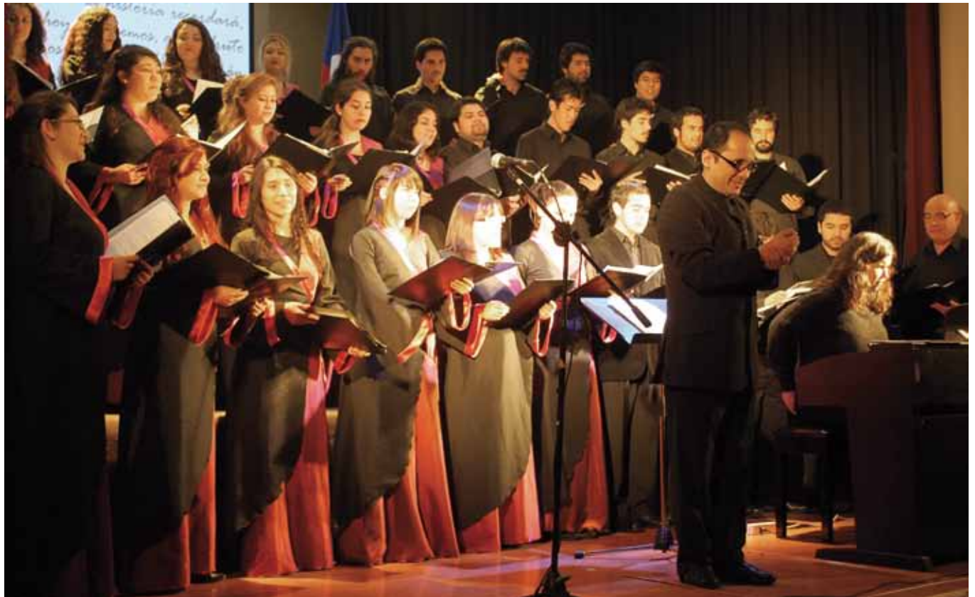
Nuevamente el Coro de la Universidad de Talca, creado casi junto con la Corporación, ha dado muestras de su gran calidad interpretativa en sus presentaciones en Peumo y en Talca.