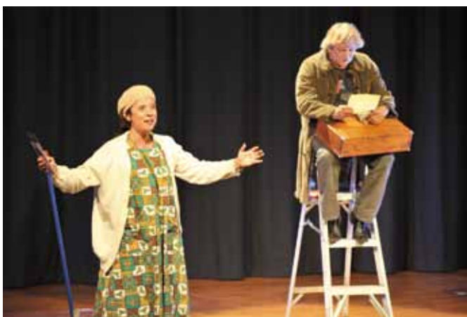
La obra fue exhibida por primera vez en París en 1980, y en Chile, su estreno se ofreció en el Salón Abate Molina de nuestra Universidad el miércoles 13 de junio.

Escanea este código y revisa el video sobre el estreno de esta obra.