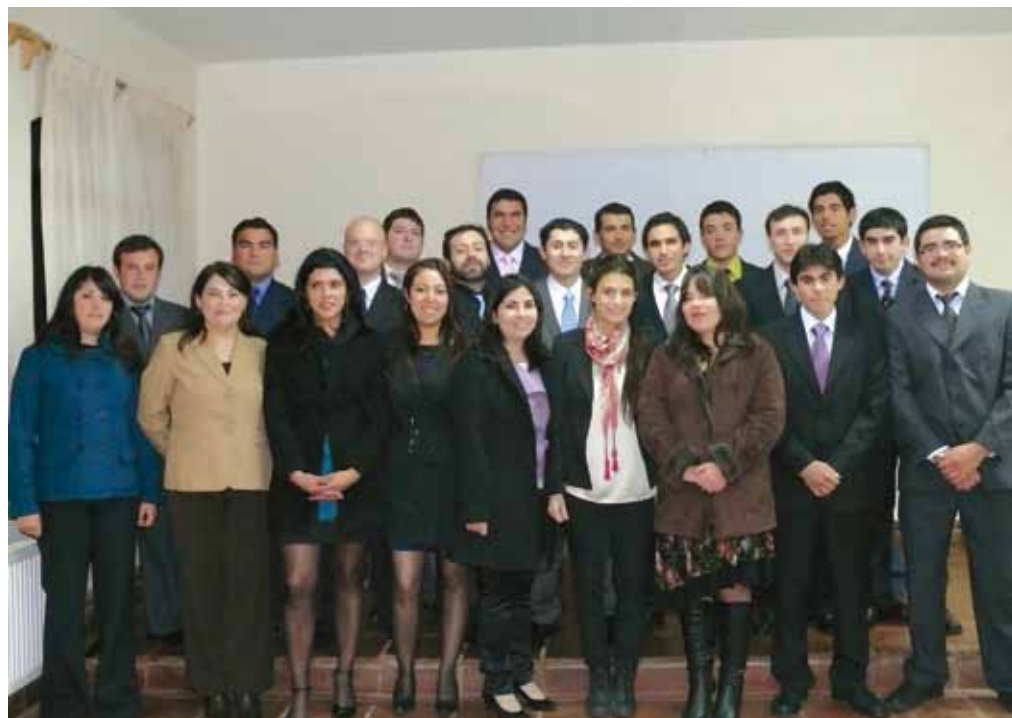
Con la formación de técnicos profesionales de alto nivel académico, la UTALCA busca ser referente en la enseñanza de competencias para la industria vitivinícola. En la imagen los 23 nuevos titulados del Campus Colchagua.