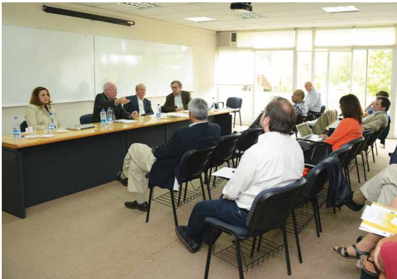
El escritor brasileño Silvano Santiago — Premio Iberoamericano de Letras José Donoso 2014 — fue uno de los invitados destacados durante las IV Jornadas de Estudio de las Ideas realizadas en el Campus Talca.

Este año la actividad se realizó desde el 4 al 6 de diciembre y contó con veinticinco expositores provenientes de distintos países latinoamericanos. Entre ellos estuvieron Antolín Sánchez, del Centro de Cien-