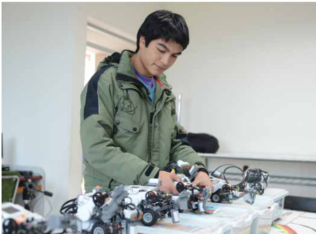
La carrera de Ingeniería en Mecatrónica ha desarrollado un camino hacia la consolidación, logrando obtener una gran inserción laboral de sus egresados.