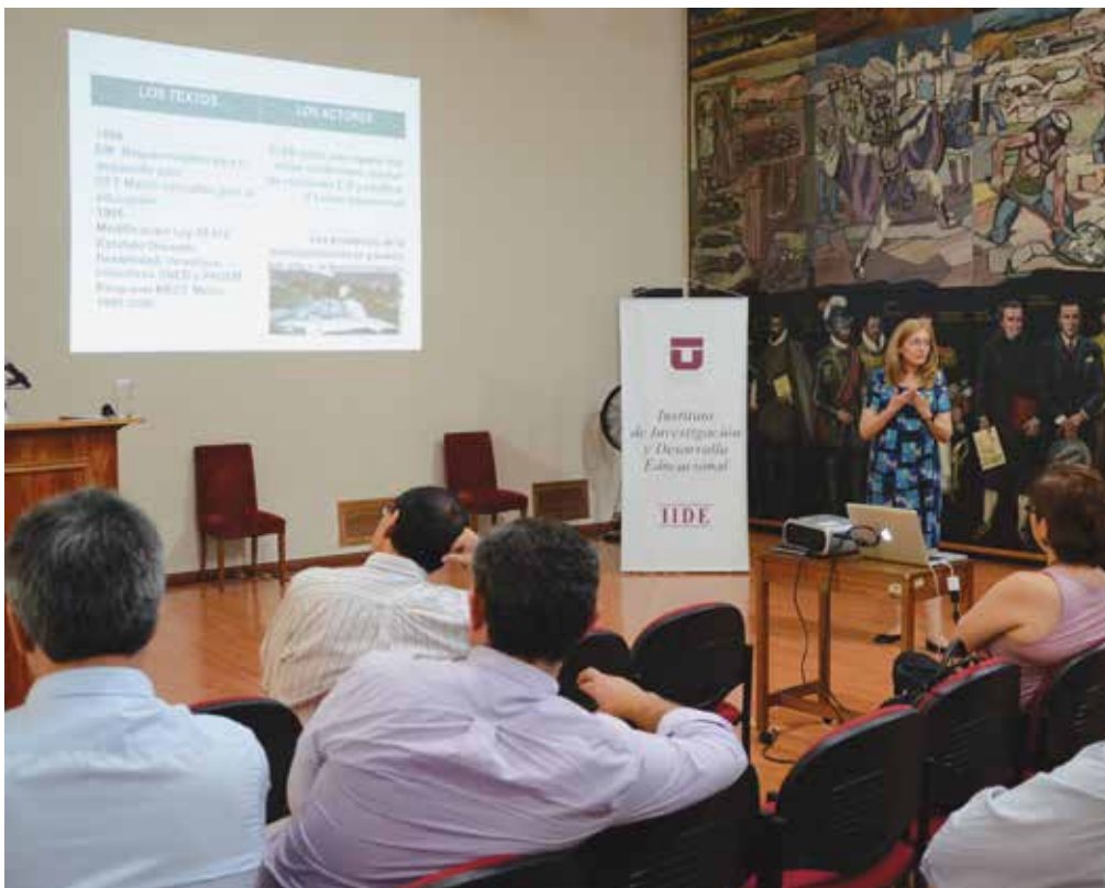
Los investigadores del proyecto Fondecyt, establecieron que durante dos décadas las autoridades no tuvieron una convicción clara de que la educación pública había que transformarla en una alternativa significativa y que no se obtuvieron los resultados educacionales esperados, debido a que el diseño de políticas públicas se hizo desde el nivel central.

Durante dos décadas y cuatros gobiernos sucesivos, las autoridades no tuvieron una convicción clara de que la educación pública había que transformarla en una alternativa significativa. Tampoco se obtuvieron los resultados educacionales esperados, debido a que el diseño de políticas públicas se hizo sólo desde el nivel central. Los avances fueron insuficientes y se incrementó la privatización de la educación.