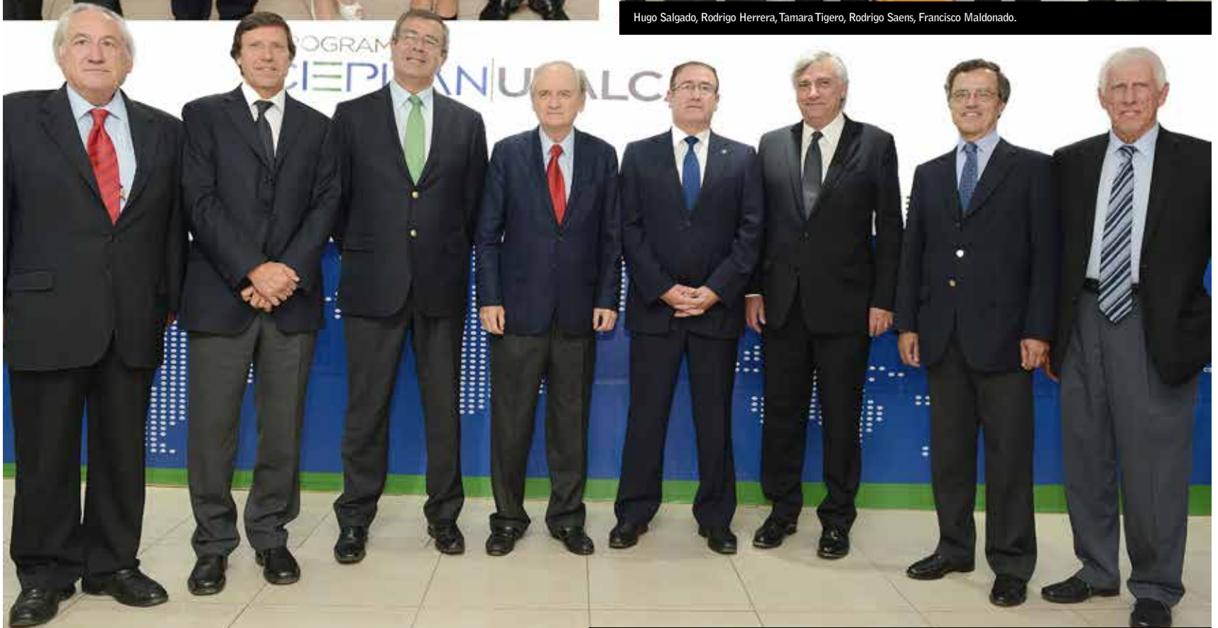
Pablo Piñera, José Pablo Arellano, Álvaro Rojas, Alejandro Foxley, Arcadio Cerda, Manuel Marfán, René Cortazar, Patricio Meller.