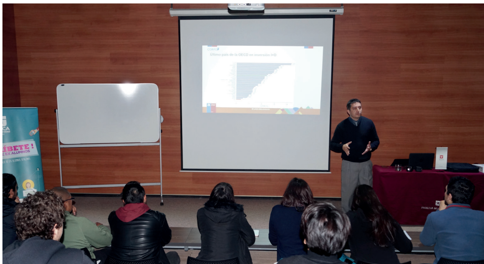
Alumnos se interiorizaron de las herramientas de las cuales pueden disponer.

En la actividad participaron alumnos de últimos años de diversas carreras de ingeniería que tienen interés en desarrollar proyectos y emprender