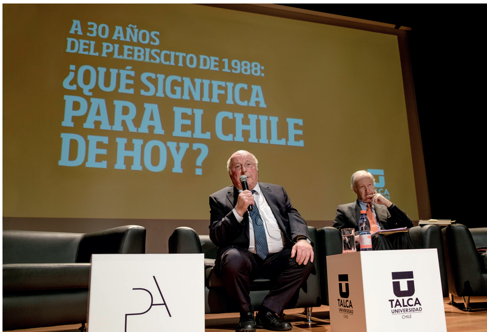
El seminario se realizó con el objetivo de promover la formación ciudadana de estudiantes en un presente donde el 80% de los jóvenes en el país no conoce qué significa el 5 de octubre de 1988 en la historia del Chile.

La Universidad reunió a personalidades que tuvieron un rol activo en el referéndum y dirigentes políticos de la nueva generación, quienes analizaron la importancia del 5 de octubre de 1988 en la construcción del Chile de hoy