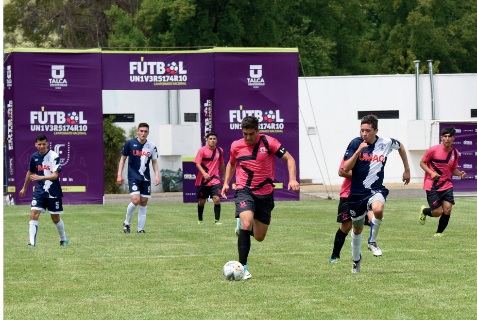
En el campeonato participaron más de 300 estudiantes de 16 universidades del país.

Las distintas selecciones que visitaron la región llegaron con la ilusión de ganar el campeonato. Las universidades que participaron repre-