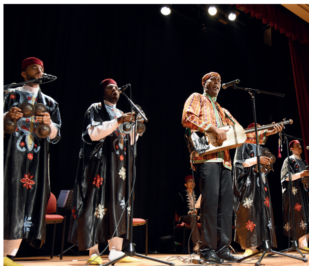
La presentación se realizó en el Teatro Abate Molina del Centro de Extensión.

El rector Rojas destacó este aporte a la descentralización de la cultura. "Es una costumbre de nuestro país que todo pase en Santiago, por eso nos compla-