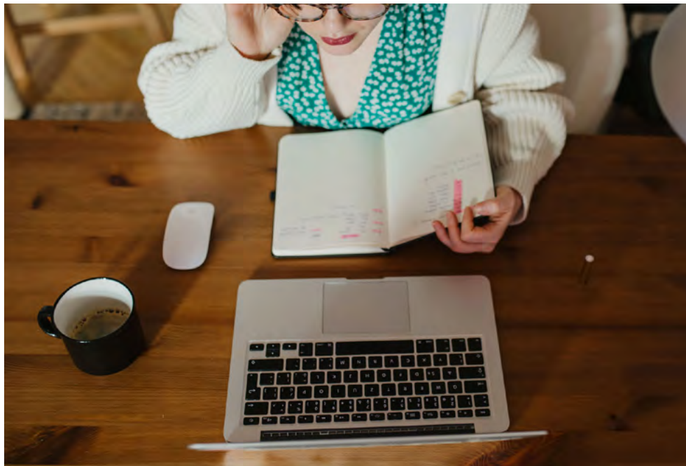
Catastro realizado por la Vicerrectoría de Pregrado permitió identificar áreas claves de intervención.

De la sala de clases a la virtual en tiempo récord. Ante la irrupción del COVID-19 nuestra Casa de Estudios tomó las medidas necesarias para modificar su formato de enseñanza presencial a otro cien por ciento a distancia.