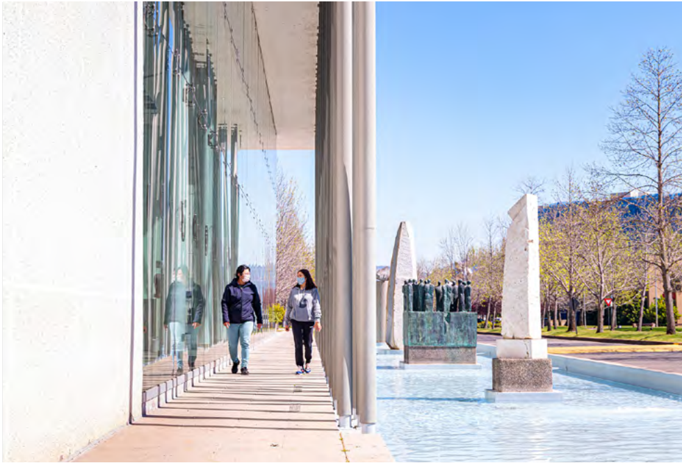
La UTalca se ha mostrado activa en su constante vínculo con la sociedad.