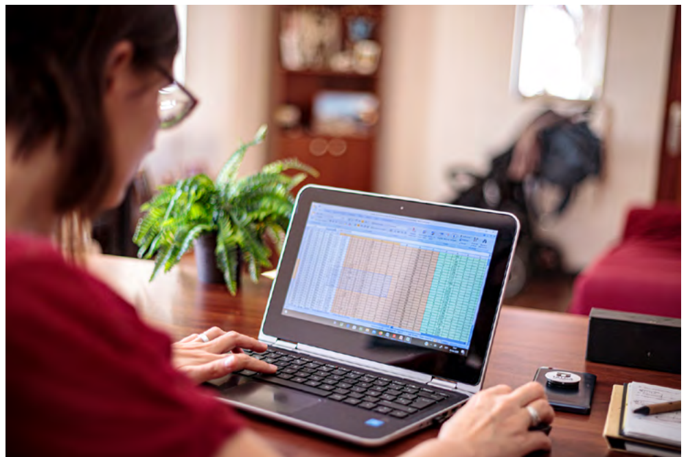
El Plan de Retorno contiene las medidas y acciones adoptadas por la Corporación en resguardo de su comunidad.

Las primeras acciones se centraron en el incremento de la capacidad de los servidores corporativos con el objetivo de que todas las unidades pudieran tener una mayor capacidad de almacenamiento de datos. Además, se mejoró la velocidad de procesamiento de datos, el ancho de banda y se hicieron ajustes al sis-